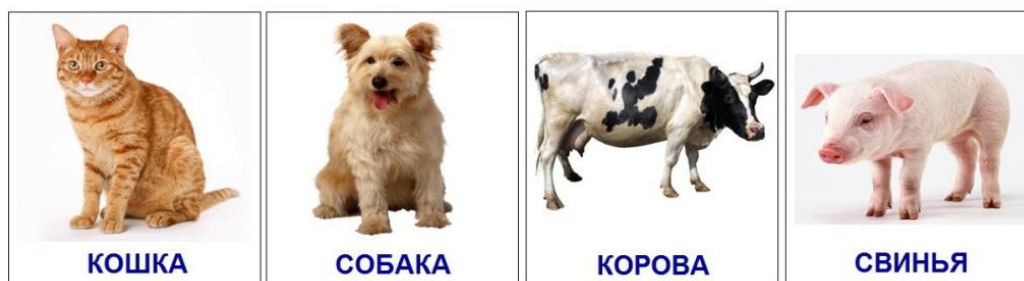
Рисунок 5. Схема для решения задачи по теории вероятности

Задание 9. Известно, что в России кошек держат 62% всего населения, собак – 32%, свиней 5%. Какова вероятность встретить в российской семье корову?